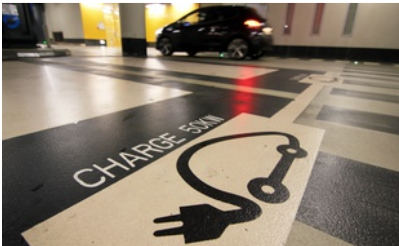
Illustration d'une place de parking dédiée à la recharge des voitures électriques. Ici dans un parking souterrain de Rennes.